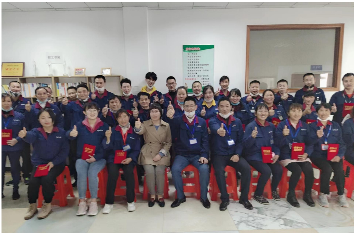
优秀员工表彰图片

织的温暖送到职工心坎，真挚的关怀使职工感到温暖，解除职工后顾之忧，关心职工生活，把工会建成职工之家。